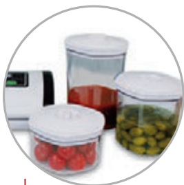
Contenitori sottovuoto Vacuum containers