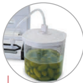
Tubo per connessione contenitori Connection tube for containers